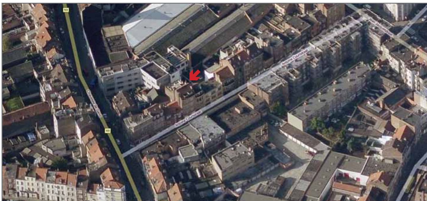
Rue Antoine Court 32 - 1081 Bruxelles